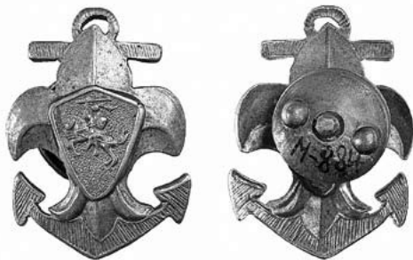
6 iliustracija. Jūrų skautų ženklelis. 1931–1940. Naujasidabris. Dydis 29 × 21 mm. Dailininkas Petras Jurgėla. Karo invalidams šelpti komiteto įmonės graverių dirbtuvės

kovo 18 d. Lietuvos jūros skautai buvo prijungti prie Lietuvos skautų brolijos. 1928 m. buvo nustatyta jūrų skautų uniforma, kurioje ženklelis nešiotas kepurėje kaip kokarda 93 . Pagal 1938 m. patvirtintą naują jūrų skautų uniformos projektą, visi ženkleliai buvo tik sidabrinės spalvos, vieni nešioti