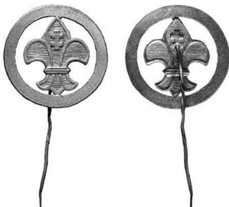
2 iliustracija. Lietuvos skautų asociacijos ir brolijos ženklelis. 1922–1929. Naujasidabris. Dydis 30 mm

projektą – leliją su Vyčiu skydelyje, bet jo projektui dauguma nepritarė 11 . Iš 1922 m. nustatytos skautų uniformos aprašymo sužinojome, kad Lietuvos skautų asociacijos ženklas – lelija ant Vyčio (dvigubo) kryžiaus nešiotas virš kairiosios marškinių ar švarko kišenės. Lelija nešiota skrybėlėje: II laipsnio skautas nešiojo varinį ženklelį, I laipsnio – žalvarinį, skiltininkas,