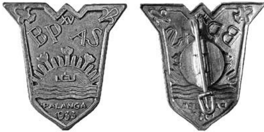
11 iliustracija. Palangos skautų sąskrydžio ženklelis. 1933. Naujasidabris. Dydis 22 × 21 mm. Dailininkas Aleksandras Šepetys. Karo invalidams šelpti komiteto įmonės graverių dirbtuvės

tės ir 1134 skautai – iš viso 1732 asmenys. Apie šiuos ženklelius yra žinoma daugiausia, nes apie juos buvo rašyta to meto spaudoje. Laikraštyje Lietuvos aidas buvo pilnai aprašytas ženklelio vaizdas ir paaiškinta, kad viršuje kampuose įdėti skautų lelijėlė ir skaučių rūtelė , žemiau BP ir AS (Baden