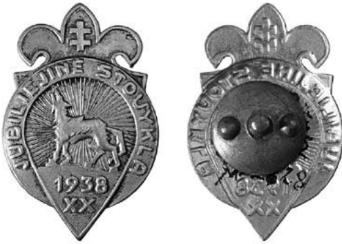
12 iliustracija. Jubiliejinės skautų stovyklos ženklelis. 1938. Naujasidabris. Dydis 33 × 22 mm. Dailininkas Vaclovas Kosciuška. Karo invalidams šelpti komiteto įmonės graverių dirbtuvės

vis dar buvo rengiamas 173 . Iš archyvinių dokumentų sužinome, kad 1937 m. gruodžio 23 d. dailininkui Kosciuškai už skautų brolijos tautinės stovyklos ženklelių, gairėlės ir plakato projektus, pagal jo pateiktą lapkričio 10 d. sąskaitą, buvo sumokėta 200 Lt 174 . Ženklelius pagamino Karo invalidams šelpti komiteto įmonės graverių dirbtuvė, kuriai 1938 m. liepos 5 d., pagal birželio 21 d. pateiktą sąskaitą, už stovyklos ženklus sumokėta 850 Lt 175 . Į graverių dirbtuvę dėl ženklelių pagaminimo buvo kreiptasi 1938 m. gegužės 4 d. su prašymu pagaminti nustatyto pavyzdžio ir dydžio 3000 vnt. ženklelių iš alpakos: 1000 vnt. su veržlelėmis (ilustracija Nr. 12) ir 2000 vnt. su žiogeliu nurodant, kad už ženklelius su veržlelėmis bus mokama ne daugiau kaip 35 ct, o su žiogeliu ne daugiau 25 ct už vnt. ir ženkleliai turi būti pagaminti