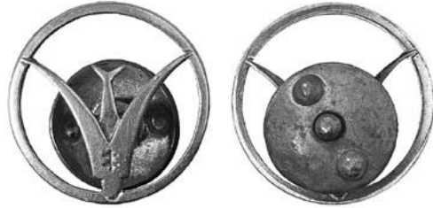
7 pav. Jaunesniųjų skautų vadų ženklelis. 1935–1940. Naujasidabris. Ø 20 mm. Dailininkas Telesforas Kulakauskas. Karo invalidams šelpti komiteto įmonės graverių dirbtuvės

1934 m. vilkiukus ir paukštytes pervadinus į jaunesniuosius skautus, buvo parengtas ir naujų ženklelių projektas – paukštytė-tulpė apskritime (ilustracija Nr. 7). Projektas buvo priimtas 1934 m. rugpjūčio 29 d. posėdyje, o jį pagamino dailininkas Telesforas Kulakauskas (1907–1977) 119 . Jis 1932 m. buvo baigęs Kauno meno mokyklos grafikos studiją. 1934 m. rugsėjo 15 d. posėdyje