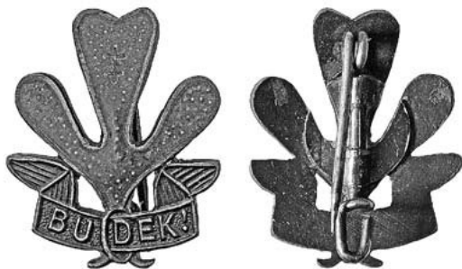
4 iliustracija. Lietuvos skautų sąjungos skaučių ženklelis. 1929?–1937. Naujasidabris, žalias emalis. Dydis 19 × 15 mm

Skaučių ženkleliai. Pirmoji skaučių draugovė įsisteigė 1918 m. gruodžio 15 d. Vilniuje, vėliau – 1920 m. Kaune, Panevėžyje, Rietave. Iš pradžių skautai su skautėmis veikė kartu, o nuo 1935 m. kovo 9 d. Skaučių seserija nuo skautų brolijos atsiskyrė. Atskira uniforma skautėms pirmą kartą buvo nustatyta 1928 m., o po atsiskyrimo 1935 m. nustatyta nauja. Skautės turėjo savo vėliavas ir ženklelius. Skaučių narių skaičius nuo 1930 iki 1935 m.