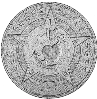
4 iliustracija. Amerikos lietuvių Romos katalikių moterų sąjungos ženklelio piešinys. 1915. Dailininkas Matas Žaldokas

Organizacijos ženklelis buvo patvirtintas I seimo metu, vykusio 1915 m. birželio 29–30 d. Ženklelis aprašytas taip: apvalus, žvaigždės formos su