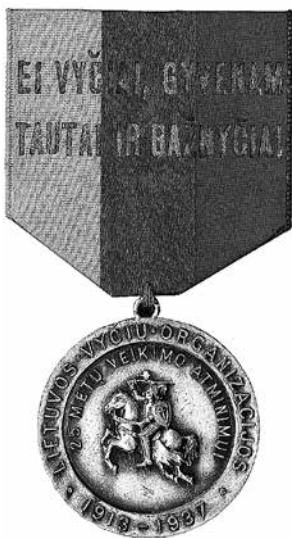
8 iliustracija. Lietuvos vyčių ženklelis. 1938. Audeklas, vario lydinys, 78 × 41 mm. NČDM, Tt 3708