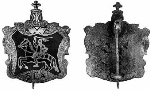
1 iliustracija. Susivienijimo lietuvių Amerikoje ženklelis. 1894. Auksas, emalė, 25 × 20,7 mm. NČDM, Nn 44542

(ilustracija Nr. 1). Tad pagamintų ženklelių išvaizda gerokai skyrėsi nuo pirminio projekto. Už ženklelių pagaminimą buvo sumokėta 221,90 USD 16 . Po pusmečio buvo pastebėta, kad ženkleliai, pardavinėti kaip auksiniai, iš tikro buvo tik paauksuoti žalvariniai, tad šį klausimą nutarta iškelti seime 17 . 1894 m. rugsėjo 25 d. įvykusiame IX seime nutarta, kad turimi paauksuoti žalvariniai ženkleliai bus pardavinėjami be jokio SLA pelno po 0,30 USD ir kartu bus pagaminti tokios pat išvaizdos nauji auksiniai 18 . Ženkleliai buvo užsakyti Niujorke firmoje Benzinger and Bros Regalia makers (įst. 1877 m.), o prieš tai dalis ženklelių (brangesnių) buvo pagaminta Baltimorėje (Merilendas), kita dalis, kainavusi