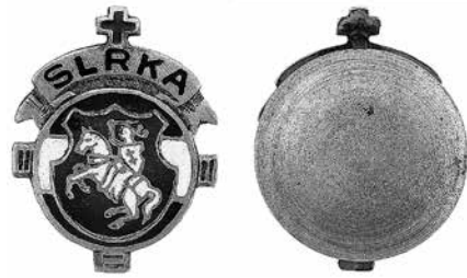
2 iliustracija. Lietuvių Romos katalikų susivienijimo Amerikoje ženklelis. 1906. Aukštas, emalė, ø 18 mm. NČDM, Nn 44495

už 250 USD 32 . Taip ir buvo padaryta. Tad ženklelių savikaina nukrito iki 0,66 USD. Kas buvo šių ženklelių gamintojas, duomenų nėra. Ženkleliai buvo dviejų rūšių – vyrams (su veržlele) ir moterims (su žiogeliu) 33 . Vėliau buvo pagaminta ir kitokių susivienijimo ženklelių. Pavyzdžiui, 1919 m. buvo reklamuojama apie galimybę įsigyti 7 variantų ženklelius: vyriškus ir moteriškus 10 karatų (416,6 prabos) aukso po 1,5 USD (ilustracija Nr. 2), vyriškus ir moteriškus auksuotus po 1 USD, anksčiau darytus moteriškus po 0,75 USD, krūtinės sagutes po 1,5 USD (ilustracija Nr. 3) ir laikrodžių pakabukams skirtus ženklelius po 1 USD 34 . Dar vėliau buvo pagaminti naujo pavyzdžio ženkleliai su pakeistomis vėliavos spalvomis. Pirmuosiuose ženkleliuose vėliava buvo žalia-balta-raudona, vėliau geltona-žalia-raudona. Kada buvo pagaminti šie nauji ženkleliai – spaudoje neminima, bet ne anksčiau 1920 m.