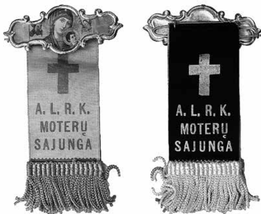
5 iliustracija. Amerikos lietuvių Romos katalikų moterų sąjungos ženklelis-juostelė. 1938. Audeklas, metalas, 110 × 40 mm. Gamintojas George Lauterer. LNM, GRD 117209/10

Aprašyti narių ženkleliai nebuvo vieninteliai šios sąjungos pagaminti ženkleliai. Kiekvieno seimo narėms ir svečiams buvo gaminti specialūs