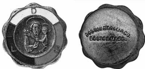
9 iliustracija. Šv. Juozapo lietuvių Romos katalikų darbininkų sąjungos ženklelis. 1915–1919. Žalvaris, emalė (raudona, balta, žalia), ø 16 mm. Gamintojas Boston Regalia Co. NČDM, Nn 30722

išvaizdos aprašymo spaudoje pateikta nebuvo, tad tenka pažvelgti į muziejinius rinkinius. Nacionalinio M. K. Čiurlionio dailės muziejaus rinkiniuose yra saugomi net 5 šios organizacijos ženklelių variantai. Jų centrinėje dalyje