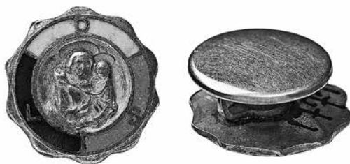
10 iliustracija. Šv. Juozapo lietuvių Romos katalikų darbininkų sąjungos ženklelis. 1921. Žalvaris, emalė (raudona, geltona, žalia), ø 16 mm. NČDM, Nn 30724

matome pavaizduotą šv. Juozapą su Kūdikėliu Jėzumi ant rankų, laikančiu migdolo žiedų šakelę. Aplinkui – trijų vėliavos spalvų apskritimas, kurio kiekvienoje spalvoje yra po vieną raidę – LDS. Vieni ženkleliai, kaip matome iš įrašų veržlelėse, buvo gaminami Bostono firmoje Boston Regalia Co , kiti Niujorko firmoje Whitehead and Hoag Company (jie yra dviejų rūšių – su veržlelėmis ir su žiogeliais), tretieji yra be įrašų. Dar vieni, taip pat be gamintojo įrašų, ženkleliai yra jau vėlesni – su pakeistomis vėliavos spalvomis (ilustracijos Nr. 9–10). Manytina, kad vieni pirmųjų ženklelių buvo pagaminti