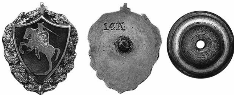
7 iliustracija. Lietuvos vyčių ženklelis. 1925. Auksas, emalė, 13,8 × 11,3 mm. Dailininkas Ignas Boreišis. Gamintojas Hankan Jewelry Co. LNM, GRD 117212/7

ir Čikagos lietuviškuose laikraščiuose. Žinant, kad prieš tai reikėjo sumokėti kompensaciją ir buvusiam gamintojui, ženklelių gamybos išlaidos tikrai turėjo viršyti jų pardavimo kainą. Šiuo metu mums yra žinomi dviejų variantų aprašytos išvaizdos ženkleliai. Vieni yra su antroje pusėje esančiu įkalu 14K (14 karatų / 585), o kiti su įrašu St. Louis Button Co. Akivaizdu, kad Hankano firmai reikia priskirti ženklelius su įkalu 14 K, o kiti ženkleliai buvo gaminti Sent Luiso (Misūris) mieste nuo 1893 m. įsteigtoje firmoje ir jie turėjo būti užsakyti vėliau.