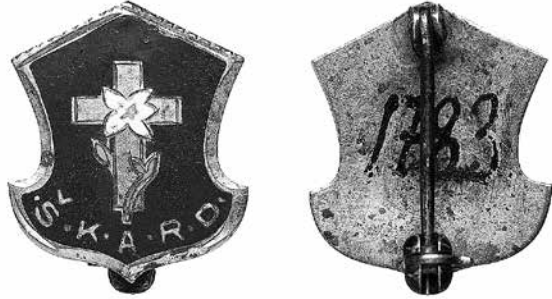
13 iliustracija. Šv. Kazimiero akademijos rėmėjų draugijos ženklelis. 1920–1923. Žalvaris, emalė, 17 × 14 mm. NCDM, Nn 30731

1931 m. gruodžio mėnesį Čikagos 8 skyriaus narės pasigamino savo skyriaus ženklelius – baltas rožes. Ženklelius pagamino ponia Gricienė; su šiais ženkleliais narės dalyvavo laidotuvėse ir šventėse 166 . 1934 m. pranešta apie tai, kad kiekviena 5 skyriaus narė gaus naujus