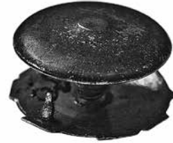
12 iliustracija. Amerikos lietuvių Romos katalikų moksleivių (studentų) susivienijimo (Giedrininkų) ženklelis. 1915 arba 1920. Žalvaris, emalė, ø 15 mm. NČDM, Nn 30730

1921 m. rugpjūčio 23–25 d. Čikagoje vykęs jubiliejinis X seimas pakeitė organizacijos pavadinimą į Giedrininkus. Kilo klausimas, ką daryti su naujai pagamintais ženkleliais, kuriuose buvo senas organizacijos pavadinimas. 1922 m. XI seime nutarta pagreitinti ženklelių pardavimą ir iki metų galo ženklelius pardavinėti po 1 USD, o vėliau po 1,15 USD – už savikainą 154 . Ženklelių platinimas, dėl jų brangumo, vyko sunkiai, todėl jų pardavimo kaina 1925 m. buvo sumažinta iki 1 USD, o 1926 m. kovo 15 d. įvykusiame centro valdybos posėdyje nutarta jų kainą nariams sumažinti