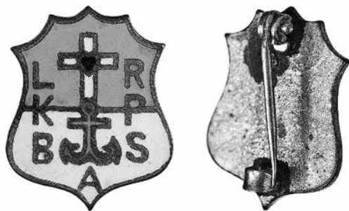
11 iliustracija. Lietuvių Rymo katalikų pilnųjų blaivininkų Amerikoje susivienijimo ženklelis. 1913–1917. Žalvaris, emalė, 16 × 13 mm. NČDM, Nn 34341

pigūs 130 . 1913 m. rugpjūčio 19 d. vykusiame III seime pranešta, kad pirmieji ženkleliai jau pagaminti ir jie yra skirti vyrams bei moterims (su žiogeliu). Seimas nustatė tokias jų kainas: sidabriniai po 0,25 USD, paaukuoti po 0,50 USD, auksiniai po 1 USD 131 . 1914 m. rugsėjo 15–16 d. vykusiame IV