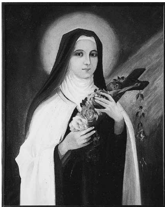
1 iliustracija. Juozo Zikaro paveikslo „Šv. Teresėlė“, nutapyto Panevėžio Švč. Trejybės bažnyčiai, nuotrauka. NČDM, ZA-345