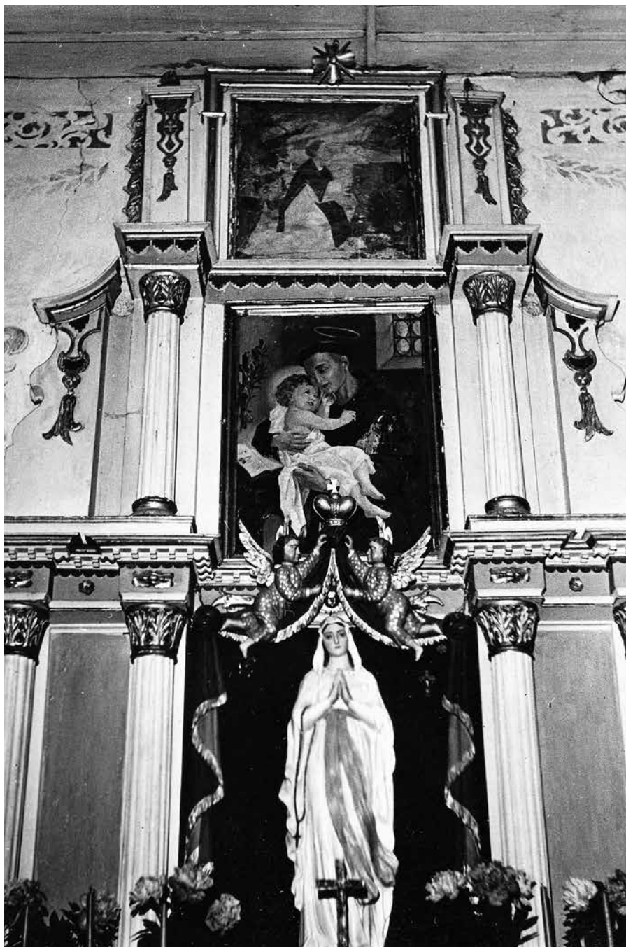
5 iliustracija. Spirakių bažnyčios šoninis altorius. Apie 1971. PKM 9854 Fp