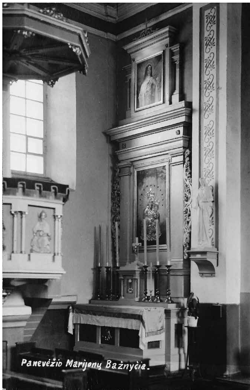
3 iliustracija. Panevėžio Švč. Trejybės (marijonų) bažnyčios šoninis altorius. XX a. ketvirto dešimtmečio nuotrauka.