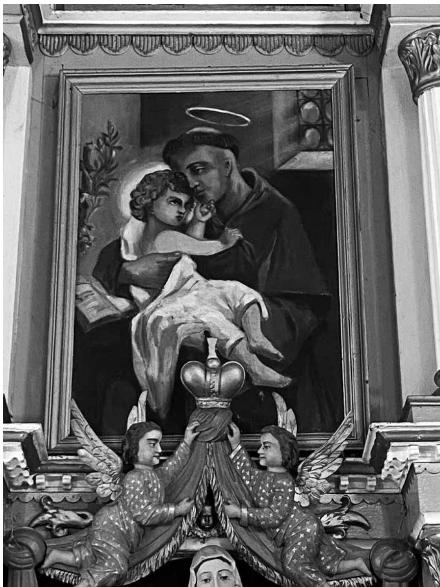
4 iliustracija. Paveikslas „Šv. Antanas“ Spirakių bažnyčios šoniniame altoriuje. 2023.