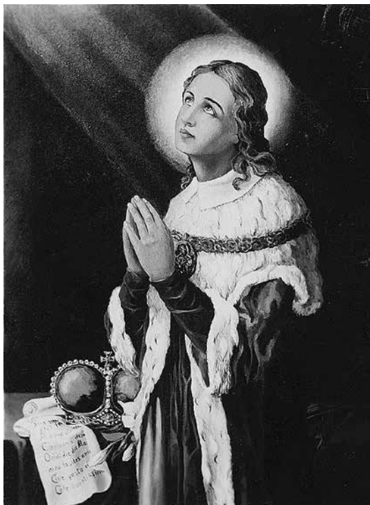
2 iliustracija. Juozo Zikaro paveikslo „Šv. Kazimieras“, nutapyto Panevėžio Švč. Trejybės bažnyčiai, nuotrauka. NČDM, ZA-346