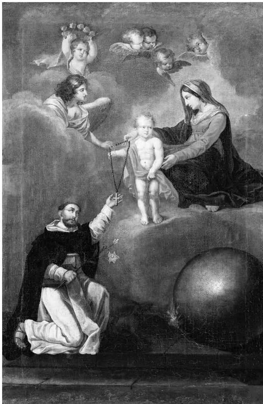
5 iliustracija. Nežinomas dailininkas. Šv. Dominyko vizija. Lietuva, XVIII a. antra pusė – XIX a. pradžia. Drobė, aliejus; 148,5 × 99,2 cm; Uk 14610. Karvio Šv. Juozapo bažnyčia.