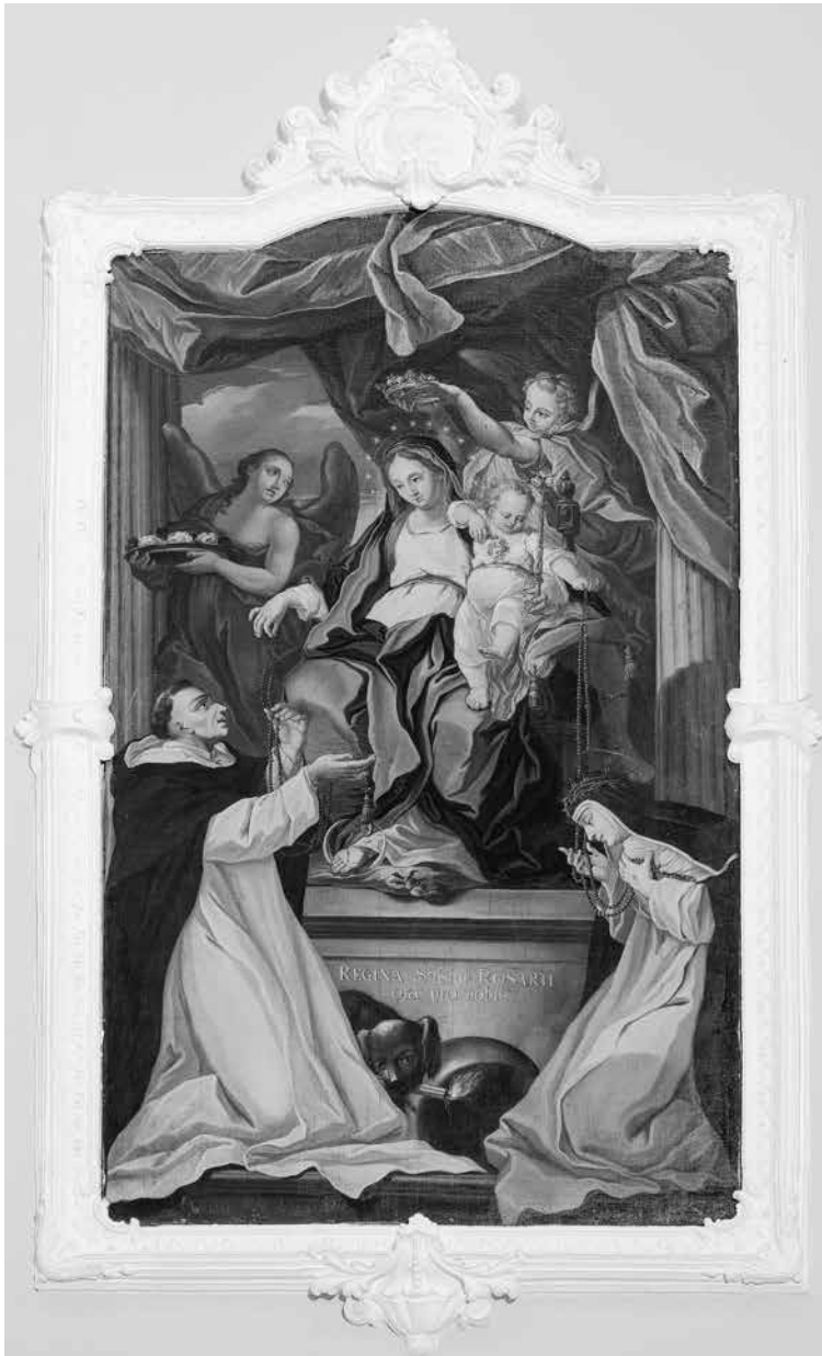
6 iliustracija. Nežinomas dailininkas (inicialai D. S.). Rožinio įteikimas šv. Dominykui ir šv. Kotrynai Sienietei. Buvęs Šv. Pilypo ir Jokūbo bažnyčios Rožinio Švč. Mergelės Marijos altoriaus paveikslas. XVIII a. antra pusė (?). Drobė, aliejus; ~230 × 120 cm; UK 8251, DV 253. Vilniaus (Žvėryno) Švč. Mergelės Marijos Nekaltojo Prasidėjimo bažnyčia.