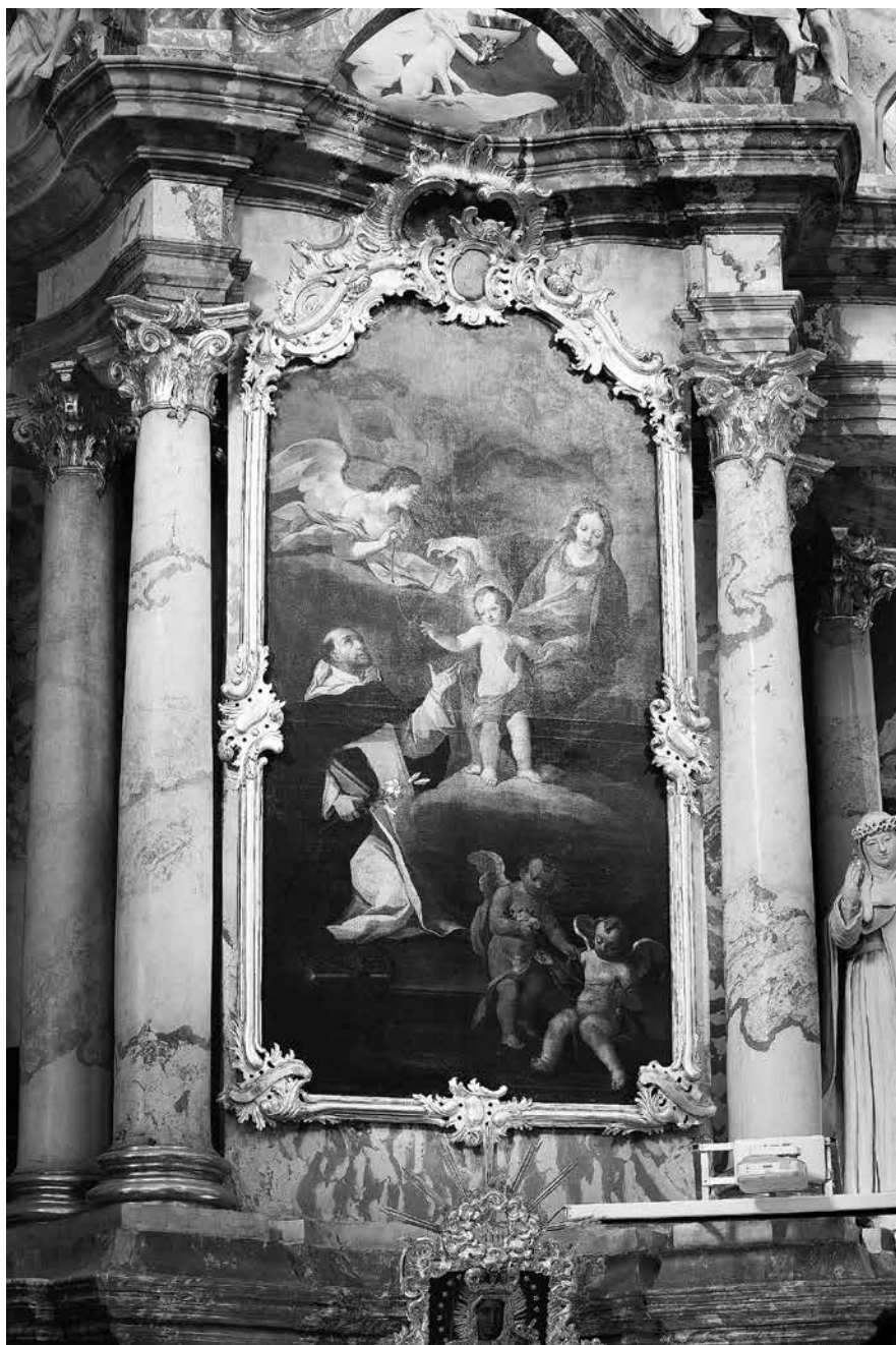
4 iliustracija. Nežinomas dailininkas. Šv. Dominyko vizija. XVIII a. antra pusė. Drobė, aliejus; 138 × 232 cm; Uk 7308. Vilniaus Šventosios Dvasios bažnyčia.