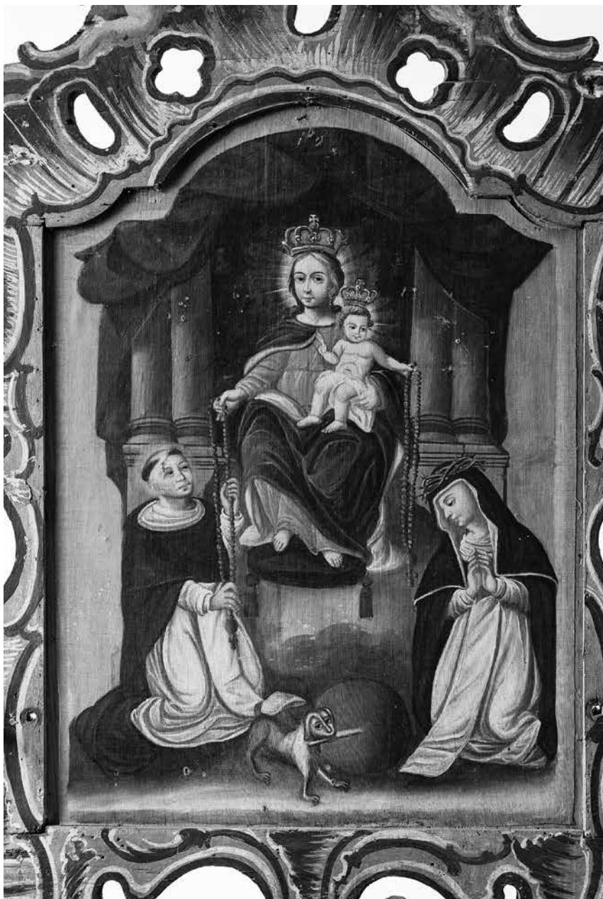
13 iliustracija. Nežinomas autorius. Procesijų altorėlis su paveikslu „Rožinio įteikimas šv. Domykui ir šv. Kotrynai Sienietei“. Kitoje pusėje – paveikslas „Švč. Jėzaus Vardas“. Lietuva, XVIII a. antra pusė (apie 1774). Altorėlis – medis, drožyba, polichromija; paveikslai – drobė, aliejus; 68 × 51 cm; Uk 38988. Pavoverės Šv. Kazimiero bažnyčia.