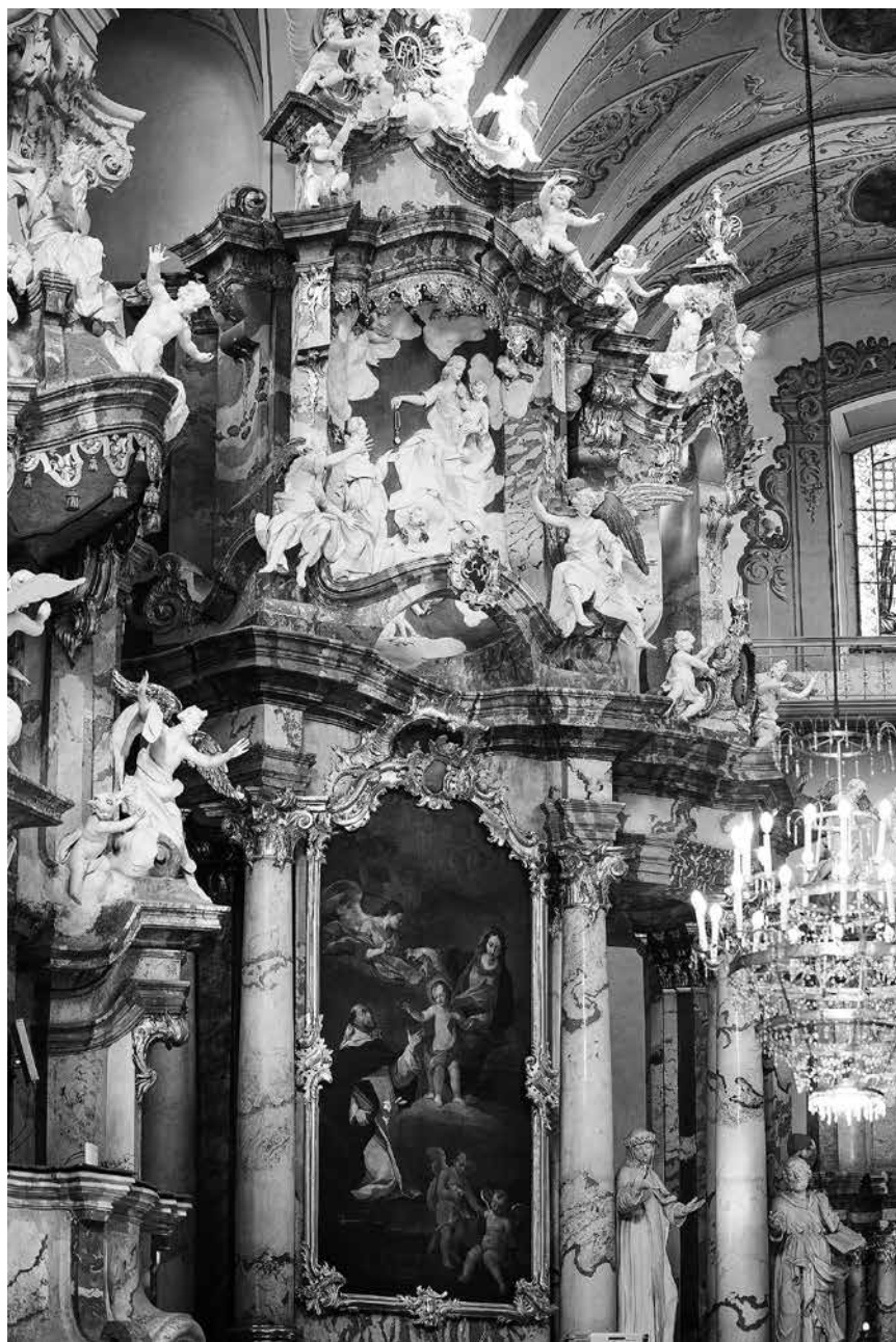
1 iliustracija. Rožinio Švč. Mergelės Marijos altorius. Apačioje – nežinomo dailininko paveikslas „Šv. Dominyko vizija“. XVIII a. antra pusė. Viršuje – Pranciškaus Ignoto Hoferio lipdinys „Šv. Dominyko vizija“. XVIII a. antra pusė. Vilniaus Šventosios Dvasios bažnyčia.