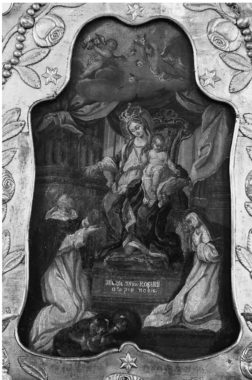
11 iliustracija. Nežinomas autorius. Procesijų altorėlis su paveikslu „Rožinio ėteikimas šv. Dominykui ir šv. Kotrynai Sienietei“. Kitoje pusėje – paveikslas „Švč. Jėzaus Vardas“. Paveikslai – skarda, aliejus; 55 ×35,5 cm; Vilnius, 1771; altorėlis – Vilnius, 1819–1830. Vilniaus Šventosios Dvasios bažnyčia. Bažnytinio paveldo muziejus, inv. Nr. BPM BP-339.