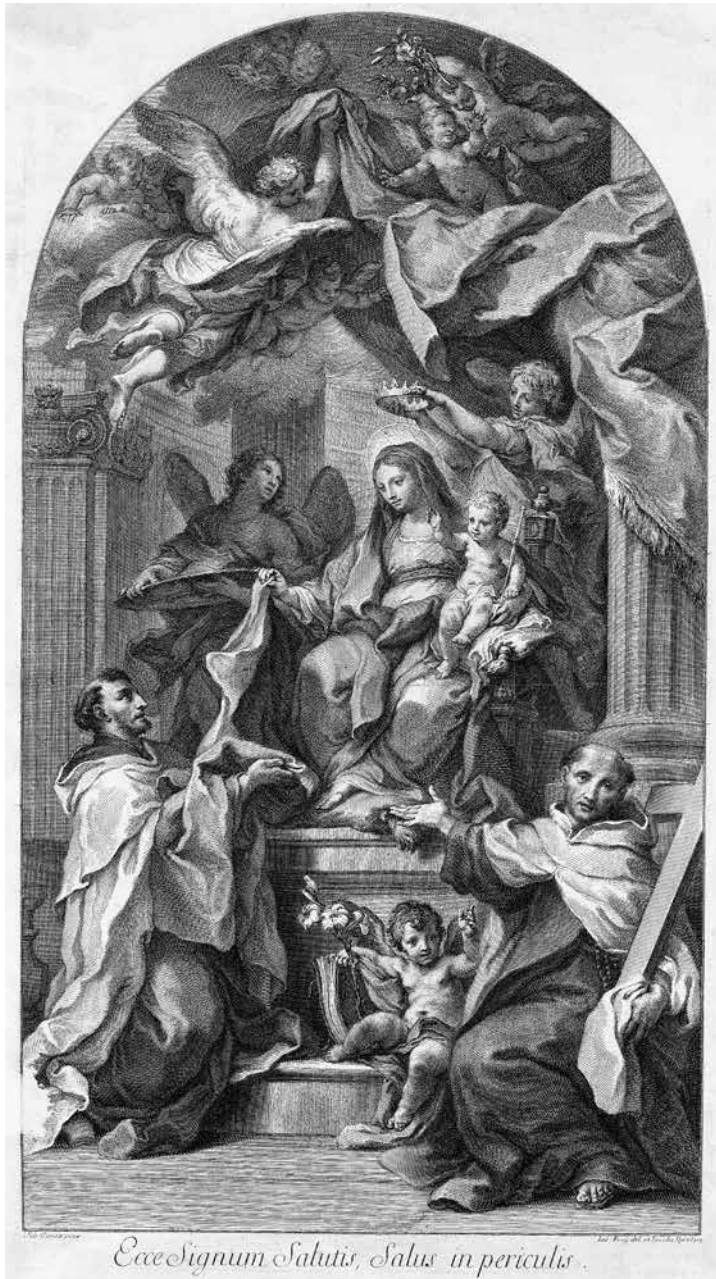
9 iliustracija. Jakob Frey. Švč. Mergelė Marija Škaplierinė su šv. Simonu Stoku ir šv. Kryžiaus Jonu. Roma, 1719. Britų muziejus, inv. Nr. 1917,1208.782. Popierius, vario raižinys; 64,4 × 37,2 (60 × 33,5) cm. Lietuvos nacionalinis dailės muziejus, inv. Nr. G 14936a