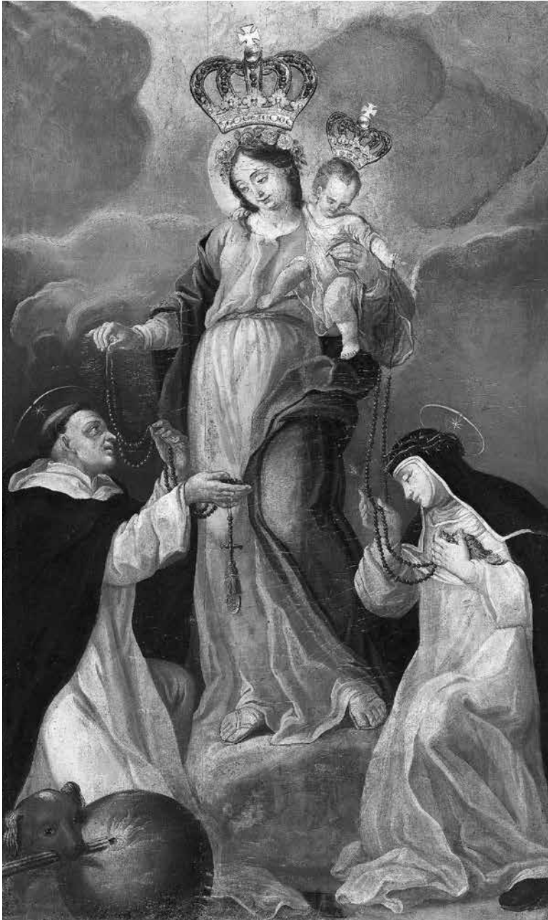
10 iliustracija. Nežinomas dailininkas. Rožinio įteikimas šv. Dominykui ir šv. Kotrynai Sienietei. Lietuva, apie 1772. Drobė, aliejus; 180 × 115 cm; Uk 10214. Vievio Šv. Onos bažnyčia. Gedo Čiuželio nuotrauka. Bažnytinio paveldo muziejaus skaitmeninis archyvas