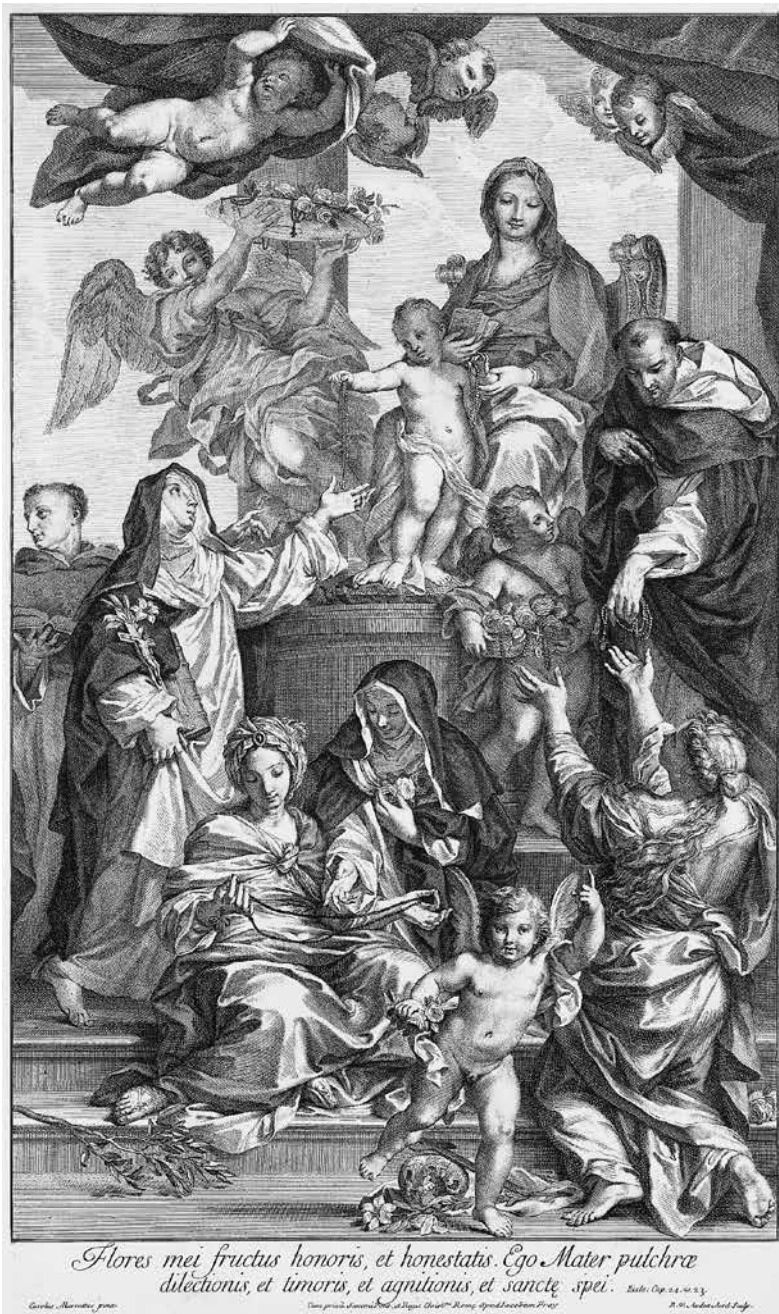
3 iliustracija. Robert van Audenaerde. Rožinio Švč. Mergelė Marija su šventaisiais. Raižinys. Roma, apie 1695. Jakobo Frey'aus atspaudas. Roma, apie 1723 m. Britų muziejus, inv. Nr. 1917,1208.476.