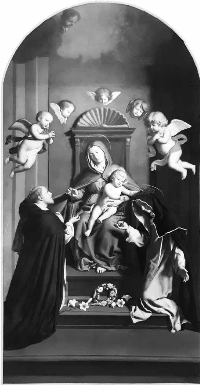
7 iliustracija. Giovanni Battista Salvi da Sassoferrato. Rožinio įteikimas šv. Dominykui ir šv. Kotrynai Sienietei. Roma, 1643 m. Drobė, aliejus; 170 × 110 cm. Romos Šv. Sabinos bazilika ( Basilica di Santa Sabina all' Aventino).