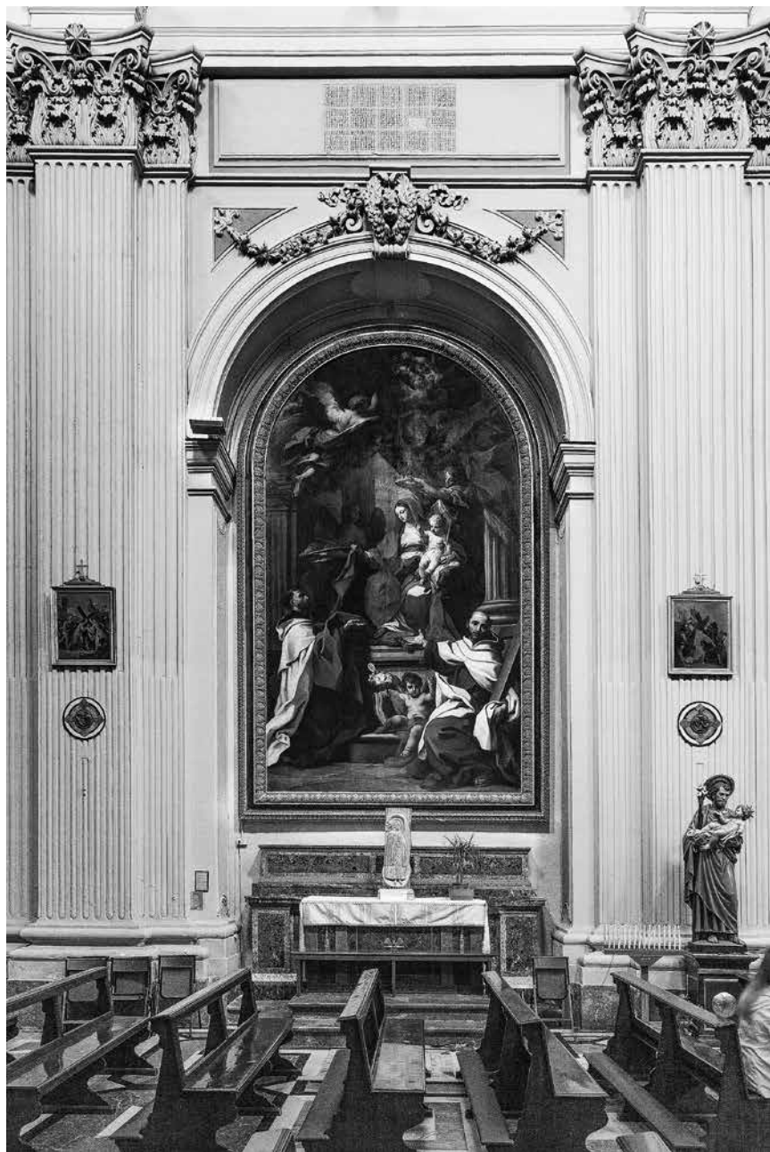
8 iliustracija. Sebastiano Conca. Švč. Mergelė Marija Škaplierinė su šv. Simonu Stoku ir šv. Kryžiaus Jonu. Roma, 1706–1719. Palermo basųjų karmelitų (buv. basųjų karmeličių) Kalsos Šv. Teresės Avilietės bažnyčia ( Santa Teresa alla Kalsa ). Dimitri Katsireas nuotrauka, spaudai parengė Gedas Čiuželis. Birutės Valečkaitės skaitmeninis archyvas