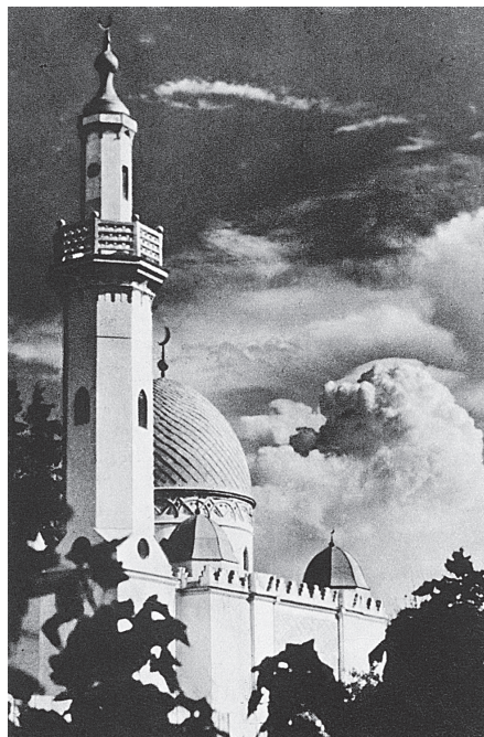
KAUNO MEČETĖ, TARPUKARIO ATVIRUKAS.