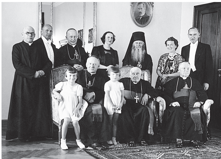
VYSKUPAI VIZITO AD LIMINA 1938 M. METU LIETUVOS ATSTOVYBĖJE PRIE ŠV. SOSTO. Lietuvos nacionalinis muziejus

toriatui iš esmės neprieštaraujant A. Aratos išvadoms, 1938 m. gegužės 6 d. buvo parengtas vyskupų memorandumas vyriausybei, kuriame protestuota prieš naujus konstitucinius nuostatus ir kitus įstatymus, reglamentuojančius Bažnyčios veiklą.