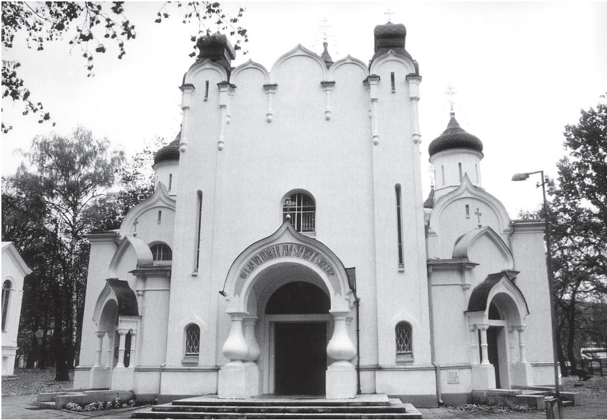
1935 M. PASTATYTA KAUNO STAČIATIKIŲ KATEDRA. 2002 m.

sąlygos – ratifikuoti „Tautinių mažumų Lietuvoje teisių deklaraciją“. Ją Lietuvos atstovai įteikė Tautų Sąjungos Tarybai 1922 m. gegužės 12 d. Deklaracijos nuostatai, įpareigoję šalies įstatymų leidybą, garantavo visų piliečių lygybę prieš įstatymus, II straipsnis pabrėžė, kad „visi Lietuvos gyventojai turės teisę laisvai praktikuoti tiek viešai, tiek privatiniai kiekvieną tikybą, religiją arba tikėjimą, jei tik toji praktika bus sutaiikoma su visuomenės tvarka ir dora“ 8 .