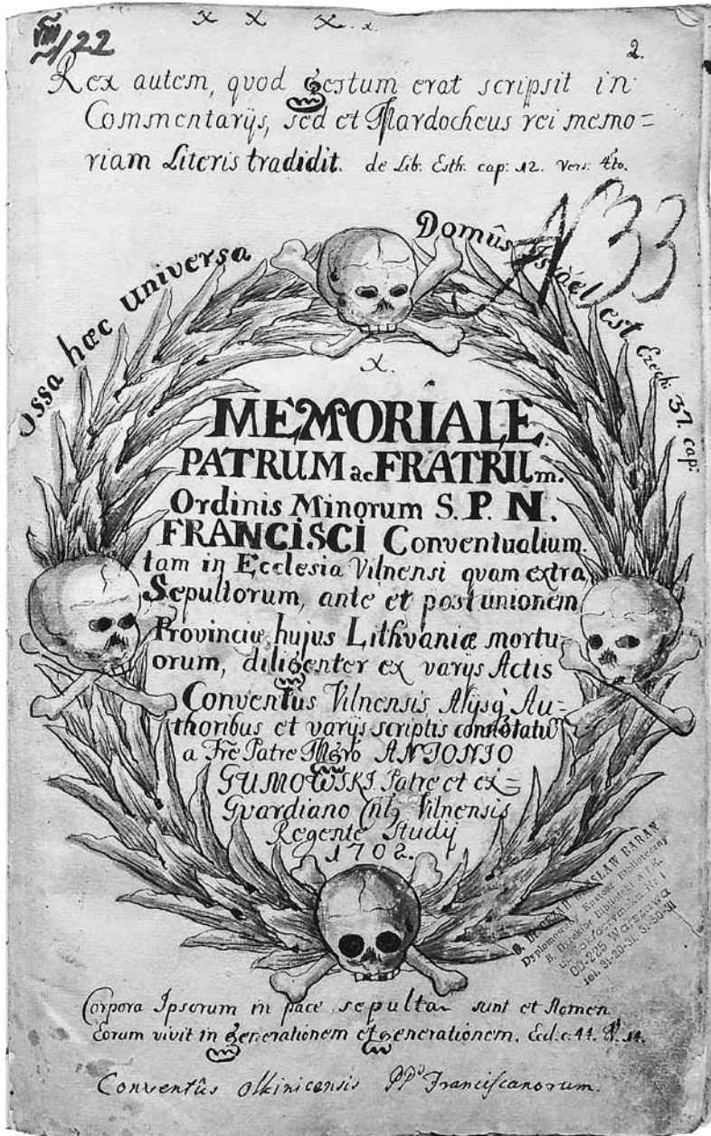
„Valkininkų nekrologas (1702–1824)“, Instytut Franciszkański, Łódź-Łagiewniki, Sygn. IF 03620/Cezar., p. 2