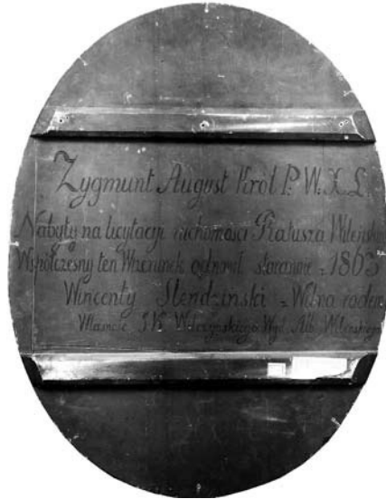
3. Žygimanto Augusto portretas. Nugarinė pusė.