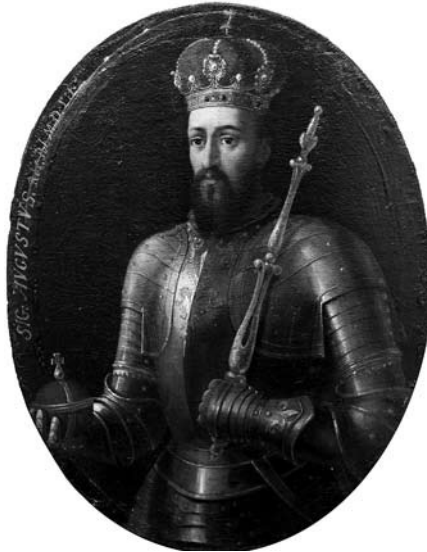
2. Žygimanto Augusto portretas.