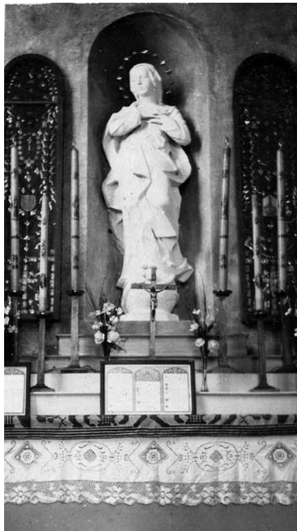
1. Švč. Mergelė Marija. Vilniaus Pranciškonų bažnyčios koplyčia. Nuotr. apie 1929.