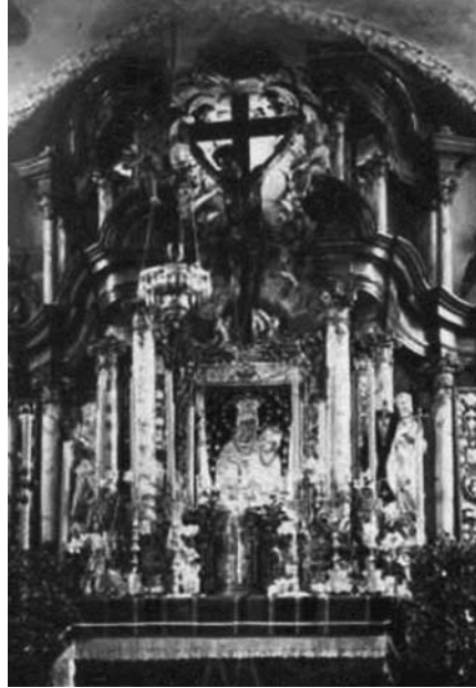
5. Švč. Mergelė Marija. Šv. Kryžiaus (Bonifratrų) bažnyčia.