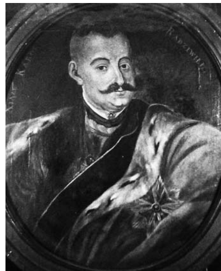
7. Karolio Stanislovo II Radvilos portretas. LNM archyvas. Nuotr. apie 1949