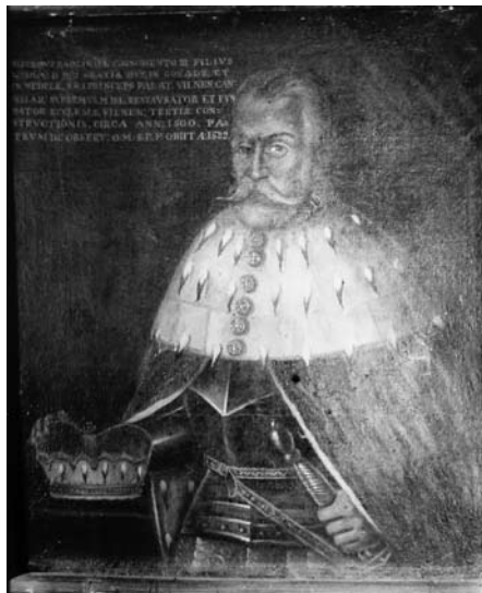
6. Mikalojaus III Radvilos portretas. LNM archyvas. Nuotr. apie 1949