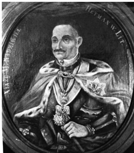
8. Mykolo Kazimiero II Radvilos portretas. Nuotr. apie 1949