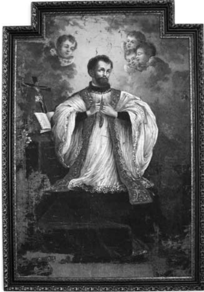
4. Šv. Pranciškus Ksaveras. Maišiagalos Švč. Mergelės Marijos Ėmimo į dangų bažnyčia. 2007

naujino ir visą pertapė 51 S. Downaras 52 . 1868 m. paveikslo restauravimo priežastis buvo apatinėje paveikslo dalyje esantys pagrindo išplyšimai. Restauravimo metu autorinės tapybos dažų sluoksnis buvo pilnai užtapytas. Greičiausiai tokių užtapytųjų priežastis buvo smulkūs autorinio grunto ir tapybos sluoksnio ištrupėjimai, taip pat autorinio dažų sluoksnio išblukimai ir nusitrynimai. Užtapytųjų sluoksnis nevienodo storio – vietomis užtapyta itin plonai ir pro užtapytųjų sluoksnį prasišviečia autorinė tapyba (figūrų veidai, rankos, raudona stula, angelų sparnai), tačiau fonas užtapytas sto-